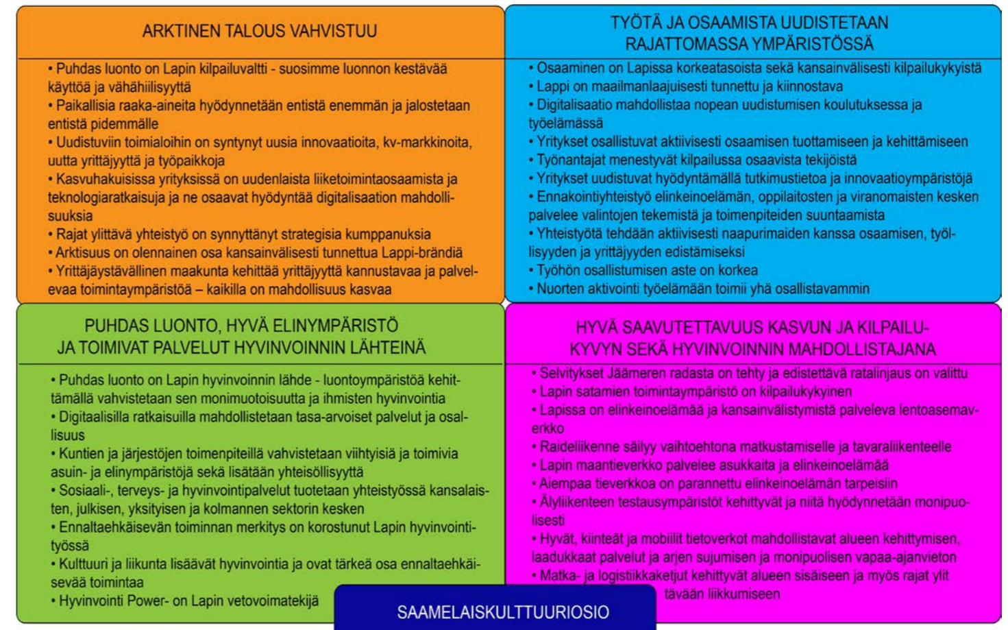
Kuva: Lappi-sopimuksen strategiset valinnat

Lappi-sopimuksen toteuttamisessa läpileikkaaviksi teemoiksi on valittu: kansainvälisyys, kestävä kehitys ja resurssitehokkuus, vähähiilisen elämäntavan edistäminen, digitalisaatio, yhdessä tekeminen sekä yhdenvertaisuus ja sukupuolten tasa-arvo.