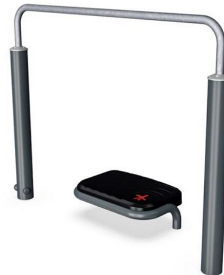
Avustettu askeltaso + steppilauta