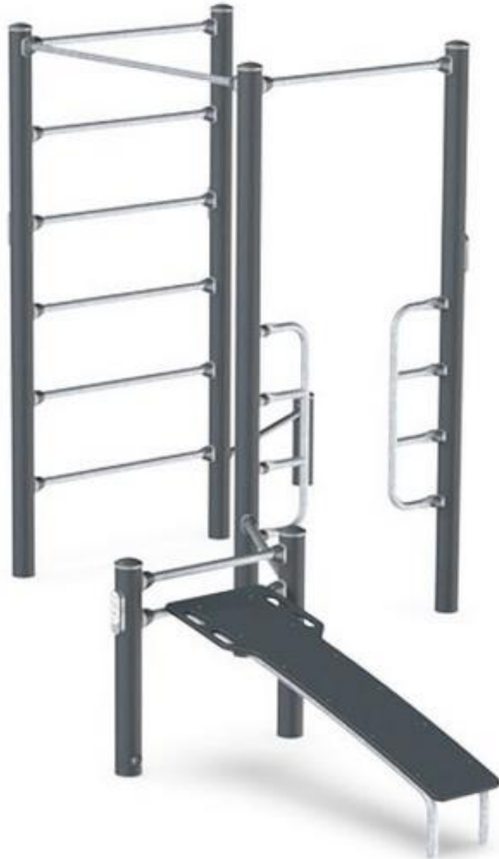
Kehonpainoharjoittelu (sis. vinopunnerrusteline, punnerrustangot, vinopenkki, puolapuut, leuanvetotanko)